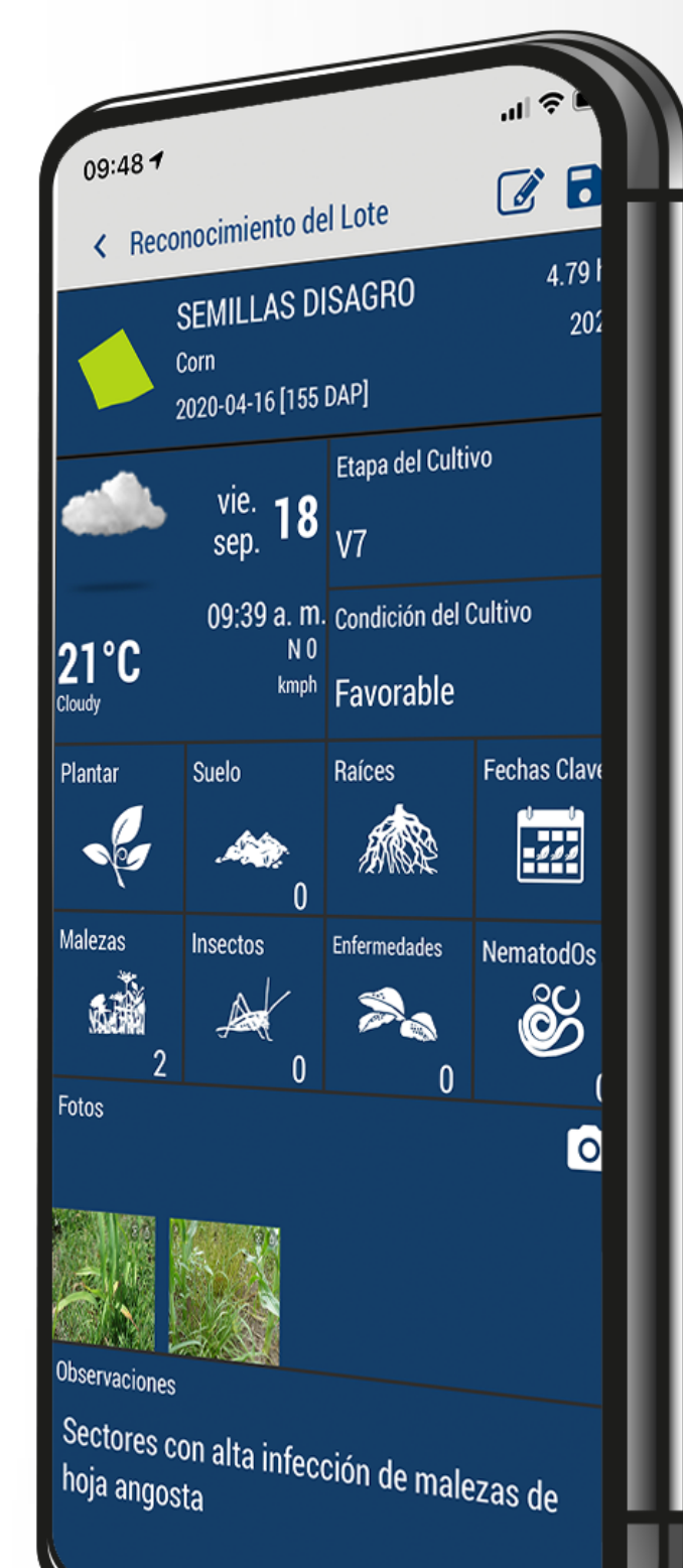
Funcionalidad de reconocimiento de lote en AgritecGEO

Con esta fuente de información el agricultor determina, con certeza, si es necesario realizar una aplicación general, o focalizada; o puede considerar realizar una aplicación variable calibrando la dosis de producto con base en el nivel de infestación de la maleza.